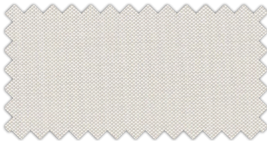
3-2201 Weiß / Beige