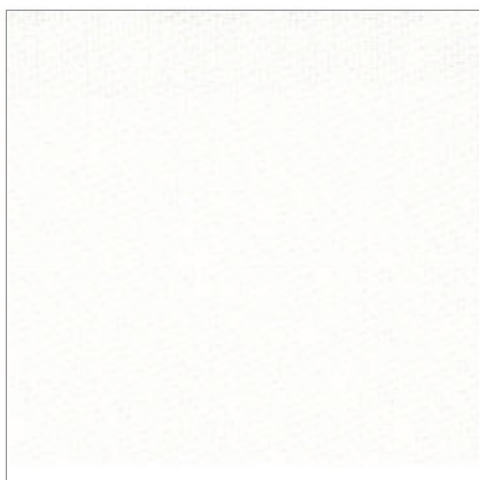
B-Screen 3% 4-5600 Weiß