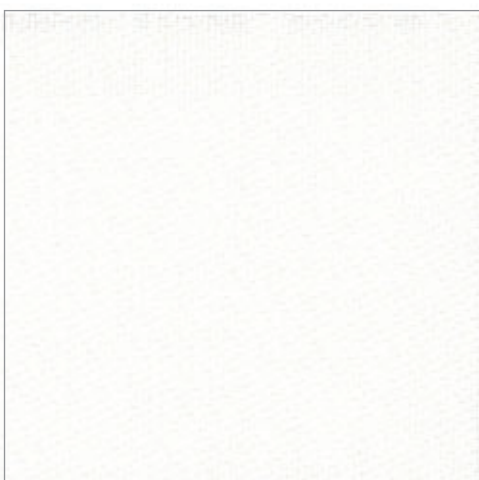
B-Screen 5% 4-5700 Weiß