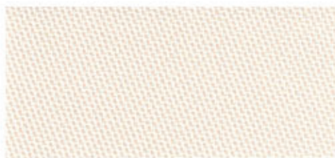
B-Screen 1% 4-5501 Creme B-Screen 3% 4-5601 Creme B-Screen 5% 4-5701 Creme