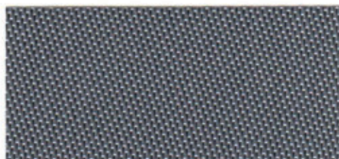
B-Screen 1% 4-5504 Anthrazit B-Screen 3% 4-5604 Anthrazit B-Screen 5% 4-5704 Anthrazit

Diese Farben sind in allen drei Qualitäten erhältlich.