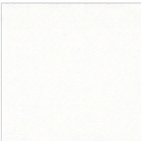
B-Screen 1% 4-5500 Weiß