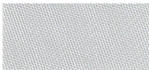
B-Screen 1% 4-5502 Perl B-Screen 3% 4-5602 Perl B-Screen 5% 4-5702 Perl