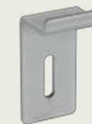
Wandträger für verdeckte Montage: 25 x 50 x 25 mm, Art.-Nr. P-5010