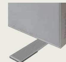
Standfuß 500 x 50 x 5 mm, Art.-Nr. P-5040