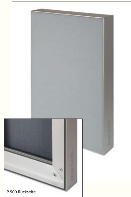
P 500 Rückseite